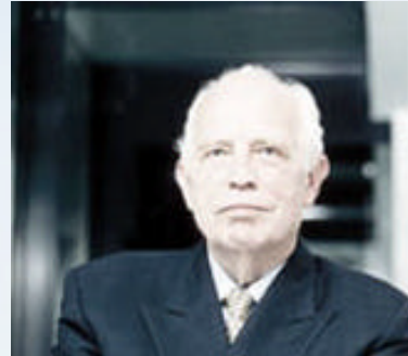
Professor Tietmeyer (Vorsitzender Kuratorium)